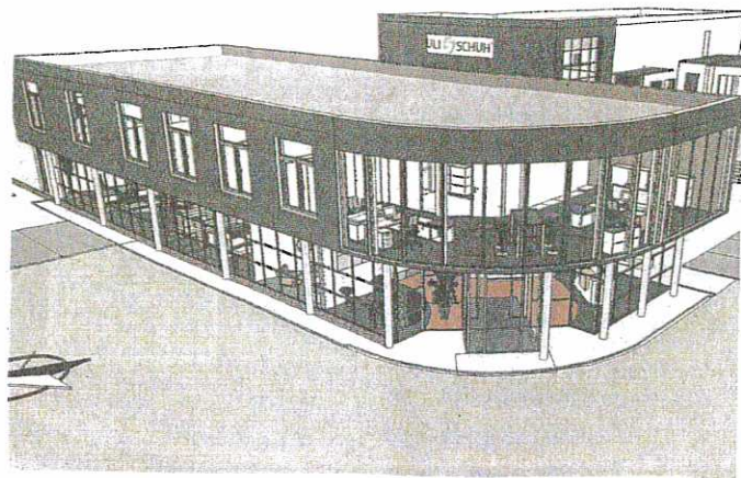
Die Skizze zeigt den geplanten Erweiterungsbau des Büro- und Kommunikationszentrums Uli Schuh in Mariatal.